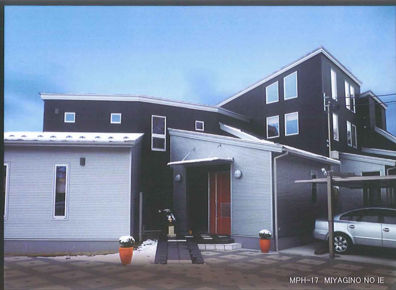
MPH-17 MIYAGINO NO IE