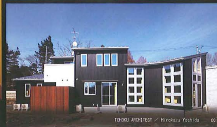
TOHOKU ARCHITECT / Hirokazu Yoshida 00