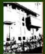
MPH-2 愛の社北欧パインの薫る家 2004.3