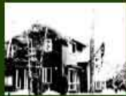
MPH-4 戴王の別荘 2004.8