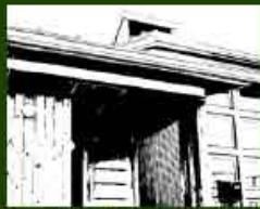
MPH-1 新富谷・現代和の家 2004年12月