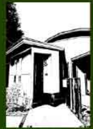
MPH-3 青葉の森に佇む ホームギャラリーのある家 2004年5月