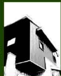
MPH-8 城南の家 2005.8