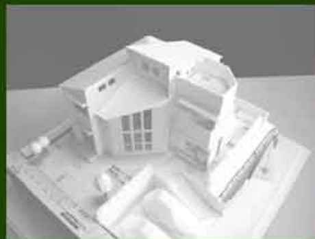
MPH-14 国見ヶ丘の家Ⅱ (模型写真) 2007.5