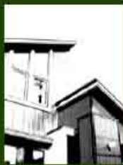
MPH-5 旧・馬坂の家 2004.12